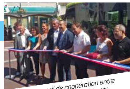
Ligne 2 : un travail de coopération entre collectivités au service des habitants.

Yvon Bourrel, Philippe Saurel, Stéphan Rossignol et les élus du Pays de l'Or inaugurent la nouvelle ligne de bus Mauguio-Odyseum. À raison de 2 voyages par heure 7j/7, la desserte n°2 du Réseau Transp'Or relie le terminus de la ligne 1 de tram en moins de 15 minutes depuis le centre-ville. Initiée dans une démarche de développement durable pour limiter les déplacements en voiture, elle s'inscrit dans la continuité de la mise en service dernièrement de la ligne 1 et constitue une réelle