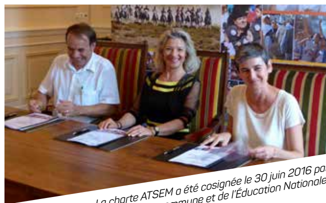
La charte ATSEM a été cosignée le 30 juin 2016 par les représentants de la commune et de l'Éducation Nationale.