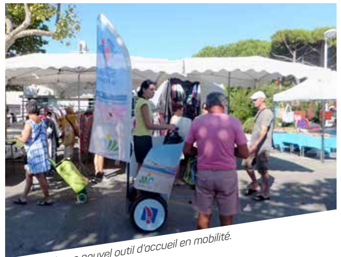
Le gyropode, un nouvel outil d'accueil en mobilité.

Autre évolution à l'œuvre depuis quelques années : l'étalement de la saison qui commence désormais dès le mois de juin et se termine courant septembre. Ce phénomène a été renforcé cette saison par la tenue de grands événements à l'Arena (Pérols), notamment avec l'Euro Basket 2015, qui a permis d'assurer un bon taux de remplissage du 5 au 10 septembre.