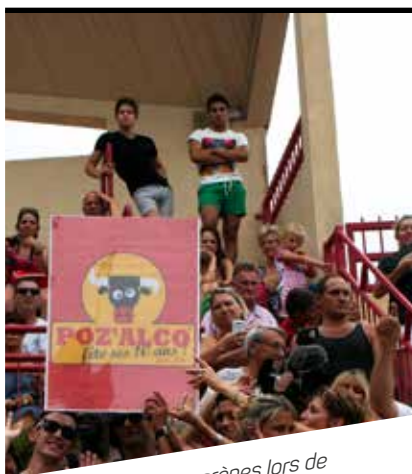
Le trophée remis aux arènes lors de l'ouverture de la fête.

Plus d'infos sur emag-mauguio-carnon.com