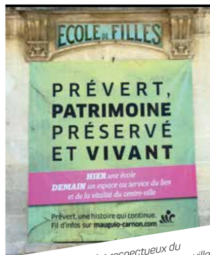
L'îlot Prévert, un projet respectueux du patrimoine et dynamisant pour le centre-ville.

Plus d'infos sur emag-mauguio-carnon.com