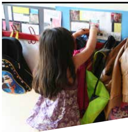
La qualité du bâti scolaire : une priorité pour la Ville.

Plus d'infos sur emag-mauguio-carnon.com