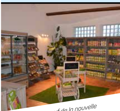
Le local flambant neuf de la nouvelle épicerie sociale.

La Ville et le CCAS de Mauguio Carnon inaugurent la première épicerie sociale de la commune au 90 boulevard Honoré d'Estienne d'Orves à Mauguio. Ce nouveau lieu destiné aux ménages Melgoriens et Carnonnais en difficulté est une alternative à l'aide alimentaire distribuée sous forme de colis. Son objectif est double : redonner plus d'autonomie aux bénéficiaires qui peuvent désormais sélectionner les aliments de leur choix et favoriser le lien social. Des ateliers seront régulièrement organisés pour sensibiliser le public aux enjeux alimentaires, à la santé et au bien-être ainsi qu'une aide administrative (déclaration d'impôts, aide à la rédaction de courriers...). Une solution de transport sera prochainement proposée pour les bénéficiaires résidant à Carnon.