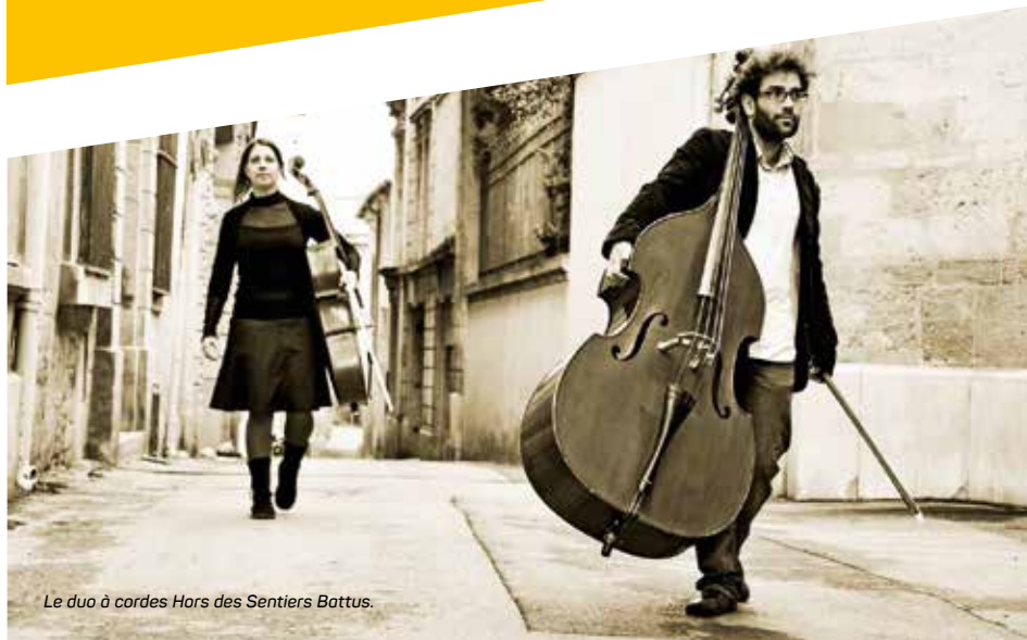
Le duo à cordes Hors des Sentiers Battus.