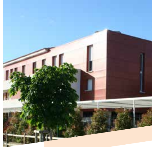
La résidence Almabella au sud est de Mauguio.