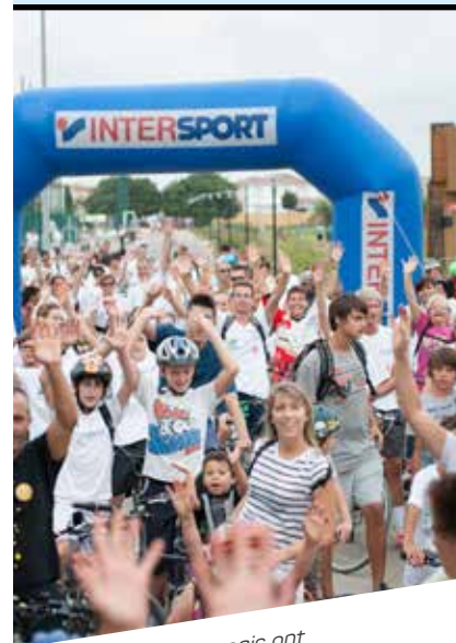
Melgoriens et Carnonnais ont répondu présents à cette 7 e édition de la Fête du Sport.

Avec près de 230 bénévoles associatifs et 1 400 participants aux épreuves, la 7 e édition de la Fête du Sport, qui s'est déroulée sur le site de la Plaine des Sports (Mauguio), a rencontré un vif succès. Au programme de cet événement familial : 35 ateliers d'initiations, une épreuve "Maug'Aventure" montée en partenariat avec les organisateurs de "La Ruée des Fadas" et des démonstrations dans des disciplines variées.